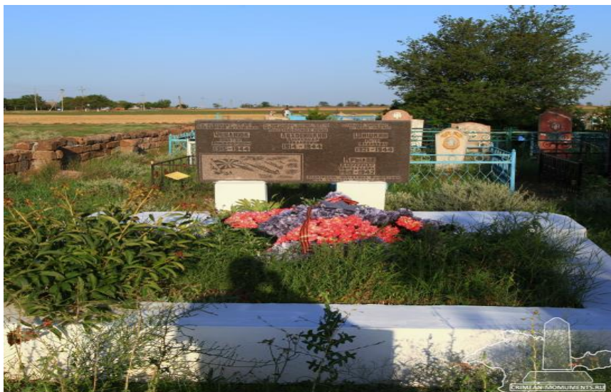
Могилы советских воинов, 1944 г. Установлены с. Красная Поляна 1945г.