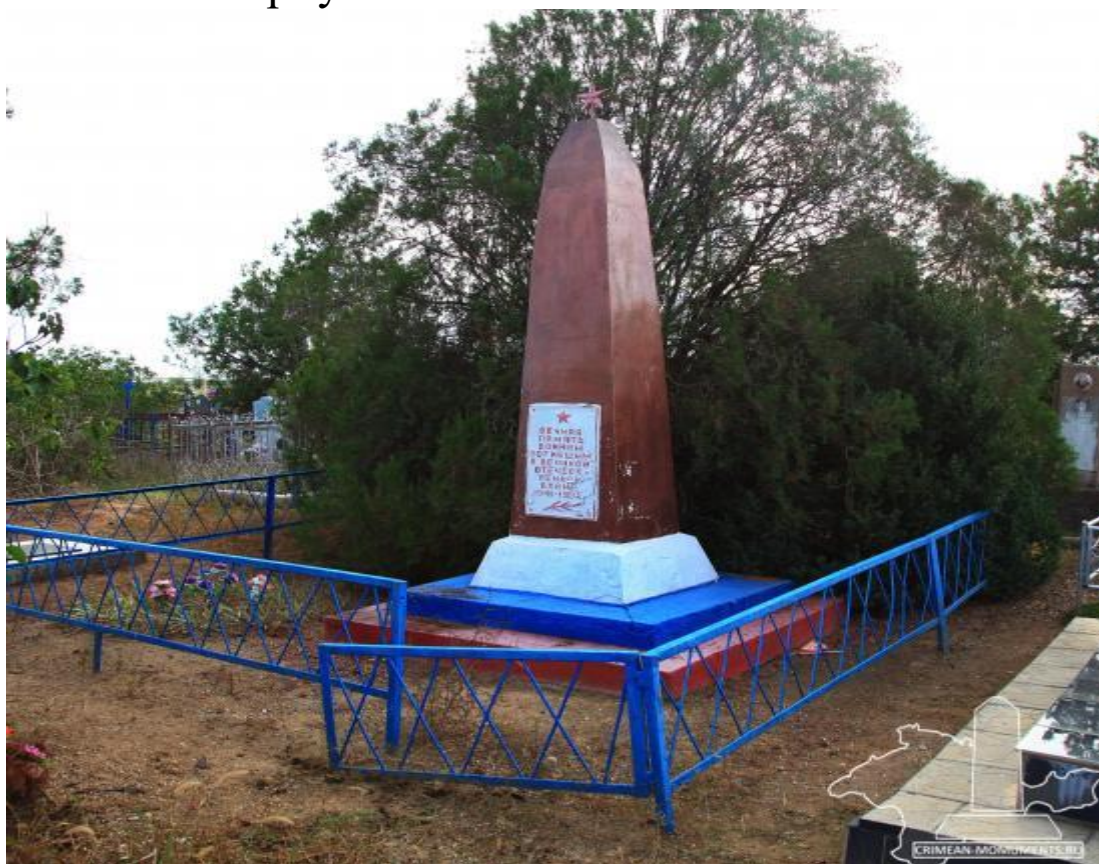
Братская могила советских воинов, 1941 г. Установлена с. Новоекатериновка 1970г.

В апреле 1944 года в ходе наступательной операции по освобождению Крыма от немецко-фашистских захватчиков в районе села Коммунары (бывшее село Анновка) погибли солдаты и офицеры из состава 417 стрелковой дивизии и 19 танкового корпуса.