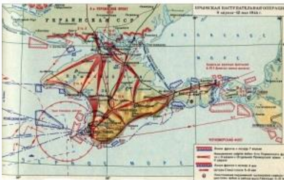
Крымская стратегическая наступательная операция 8 апреля – 12 мая 1944 года

После разгрома немецко-фашистских войск под Сталинградом и Курском в 1943 году стратегическая инициатива на Восточном фронте перешла в руки советских войск. 1944 год стал годом освобождения территории Советского Союза от гитлеровских и союзных им войск и годом выхода Красной Армии к государственной границе СССР 1941 года и её восстановления.